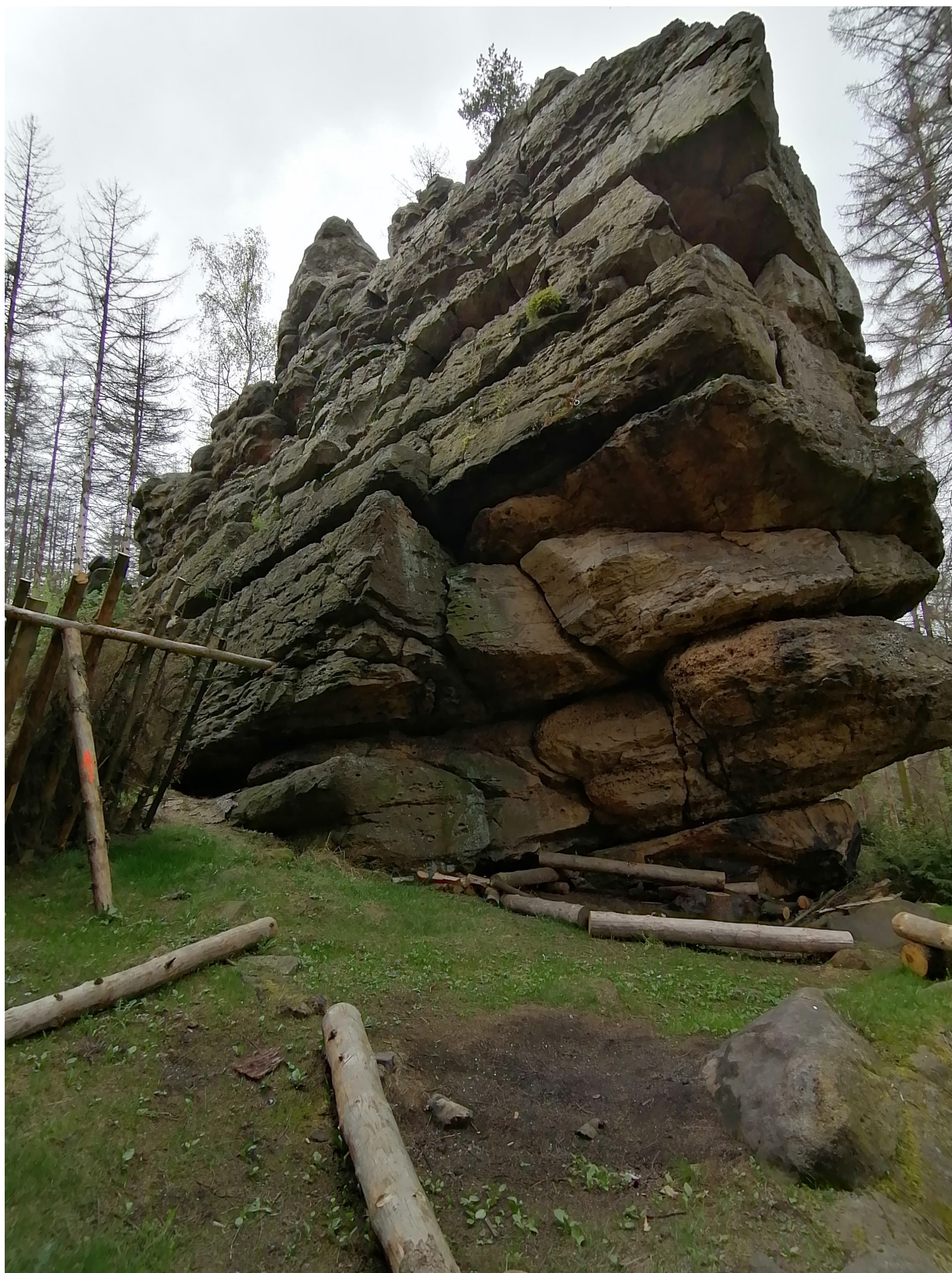
Obrázek č. 1/2