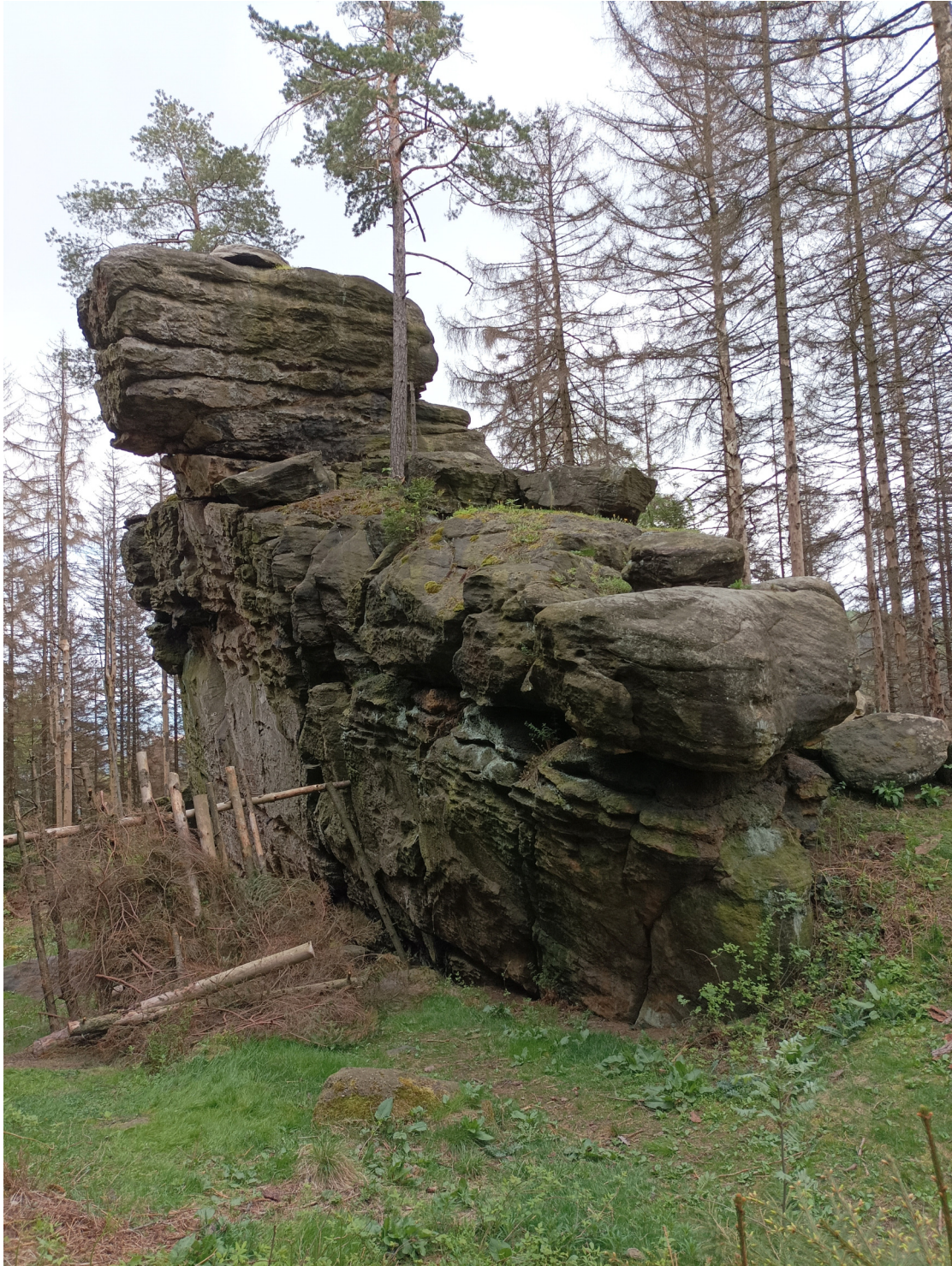
Obrázek č. 1/4