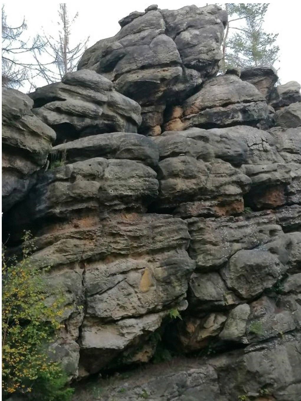
Obrázek č. 1/6