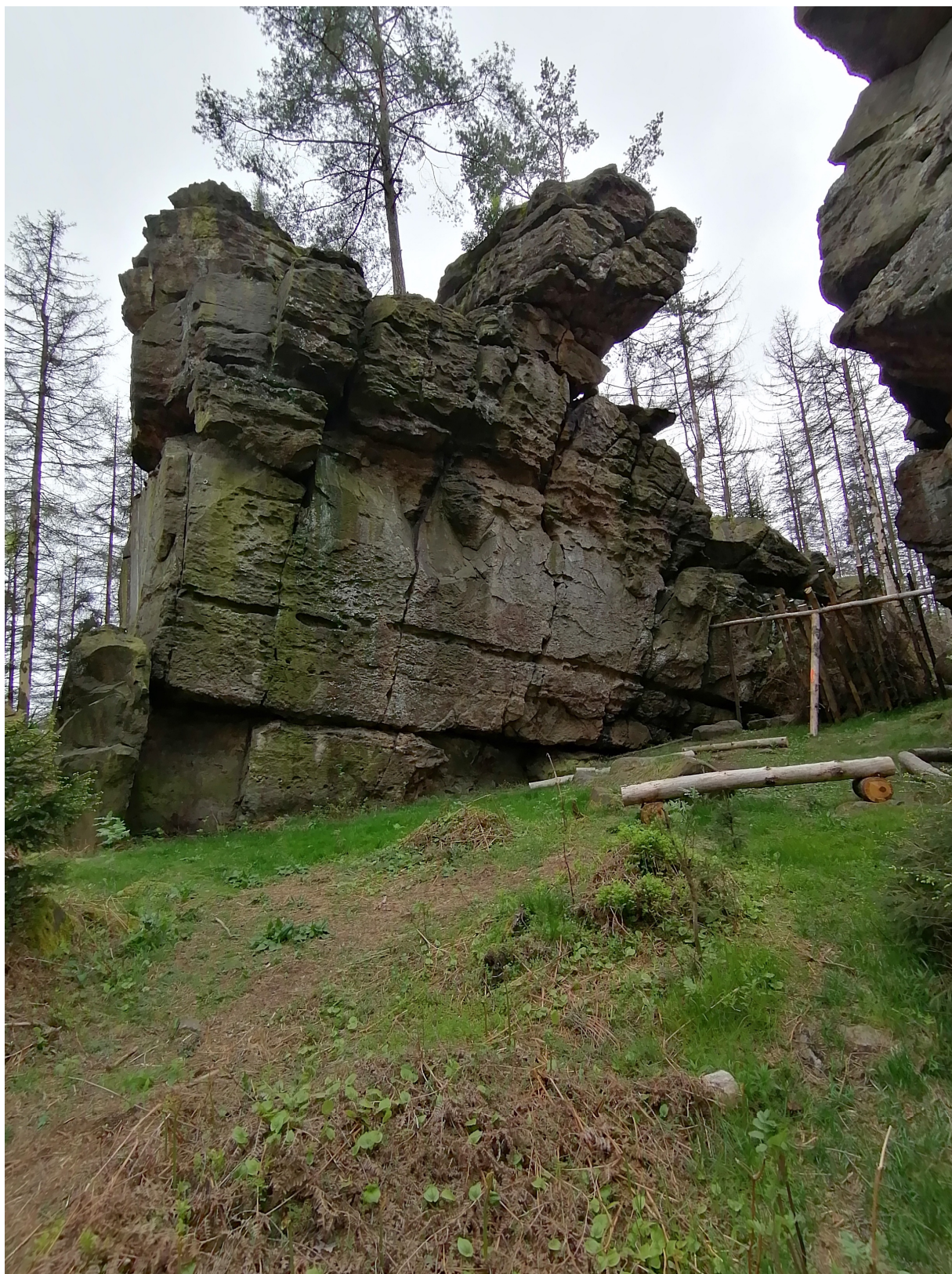
Obrázek č. 1/2

Plocha s vyobrazením knížecí družiny a božstvy