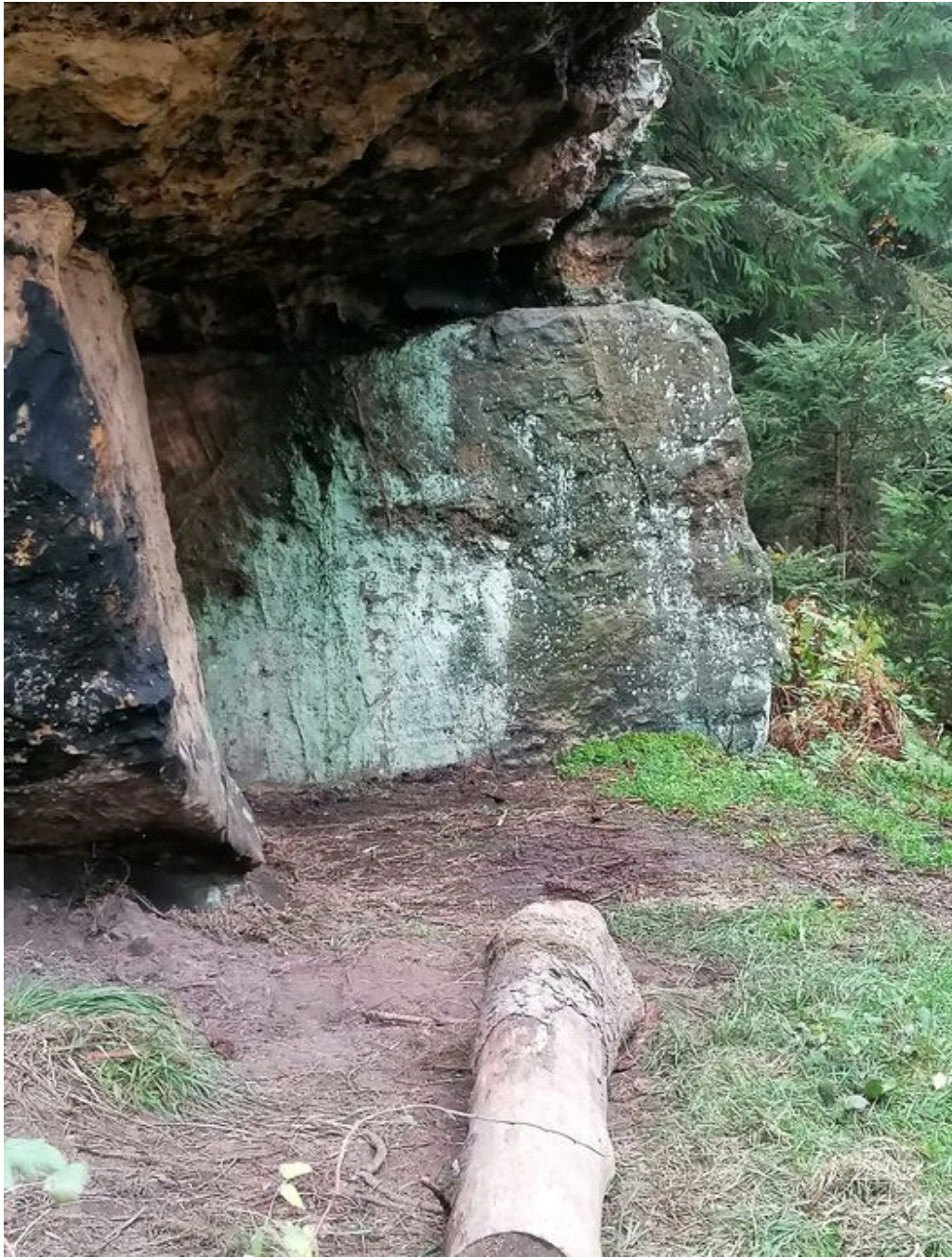
Obrázek č. 1/1