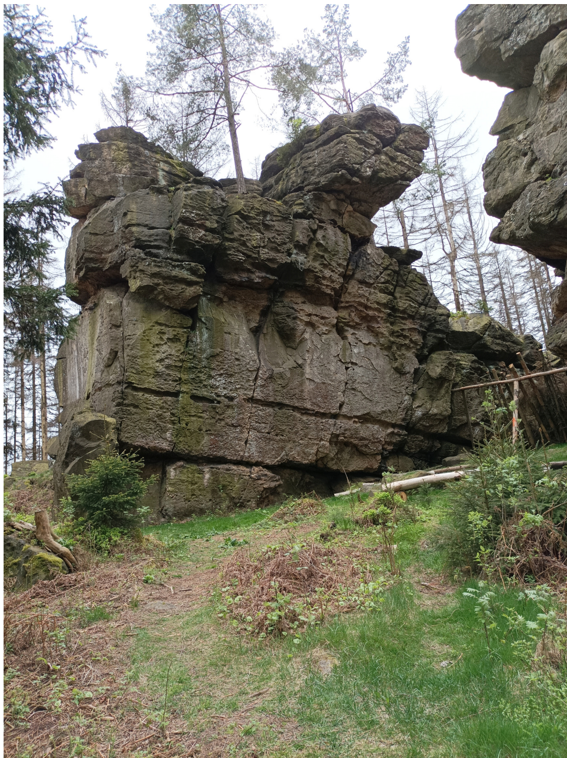
Obrázek č. 1/1