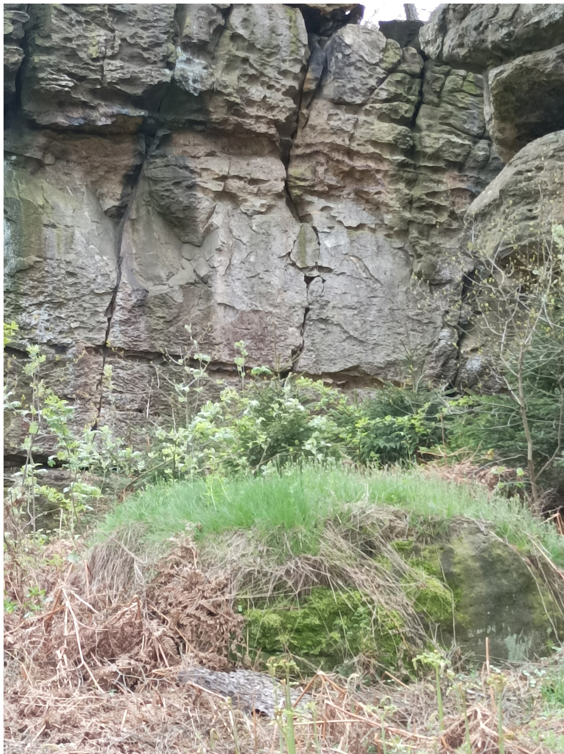
Obrázek č. 1/3