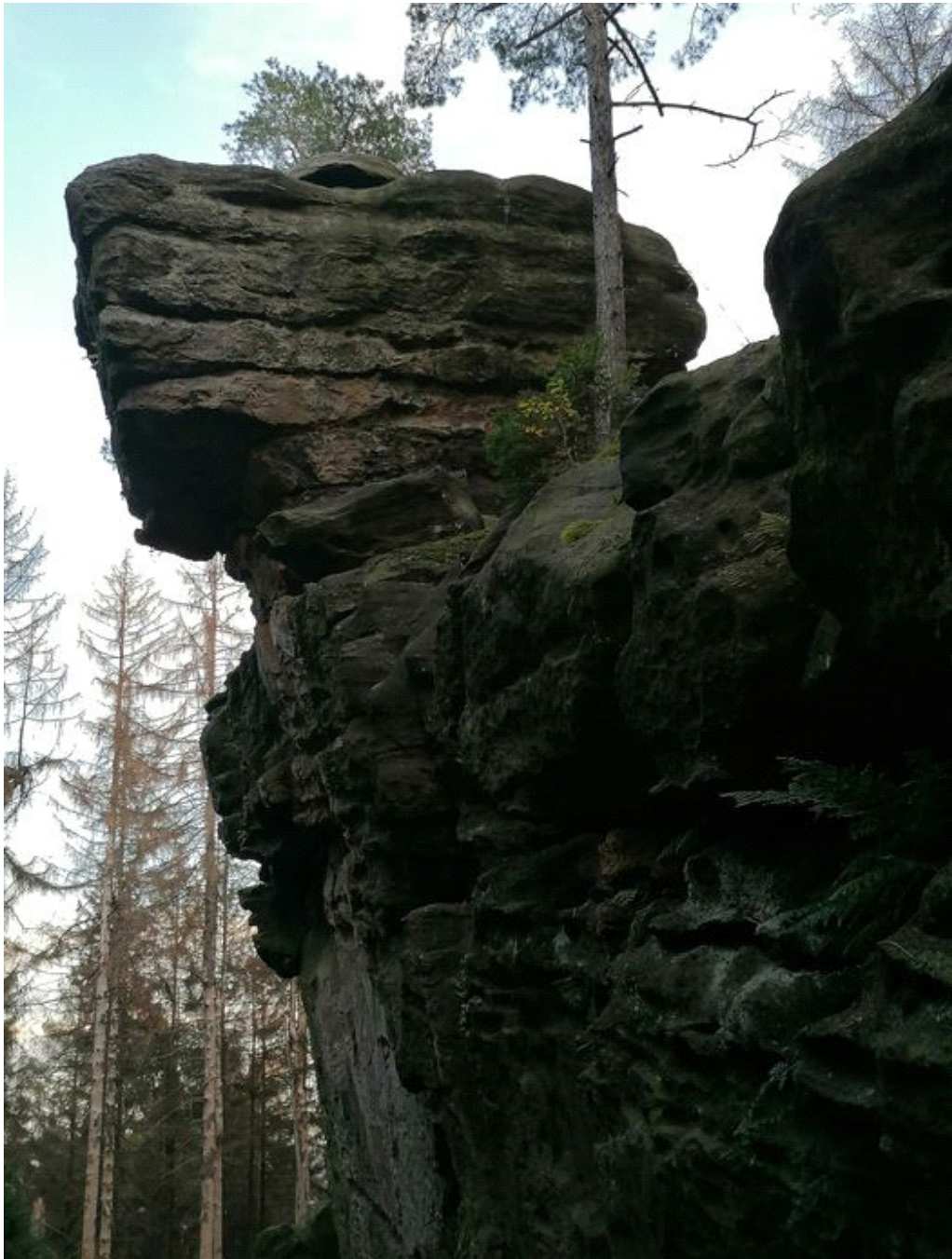
Obrázek č. 1/5